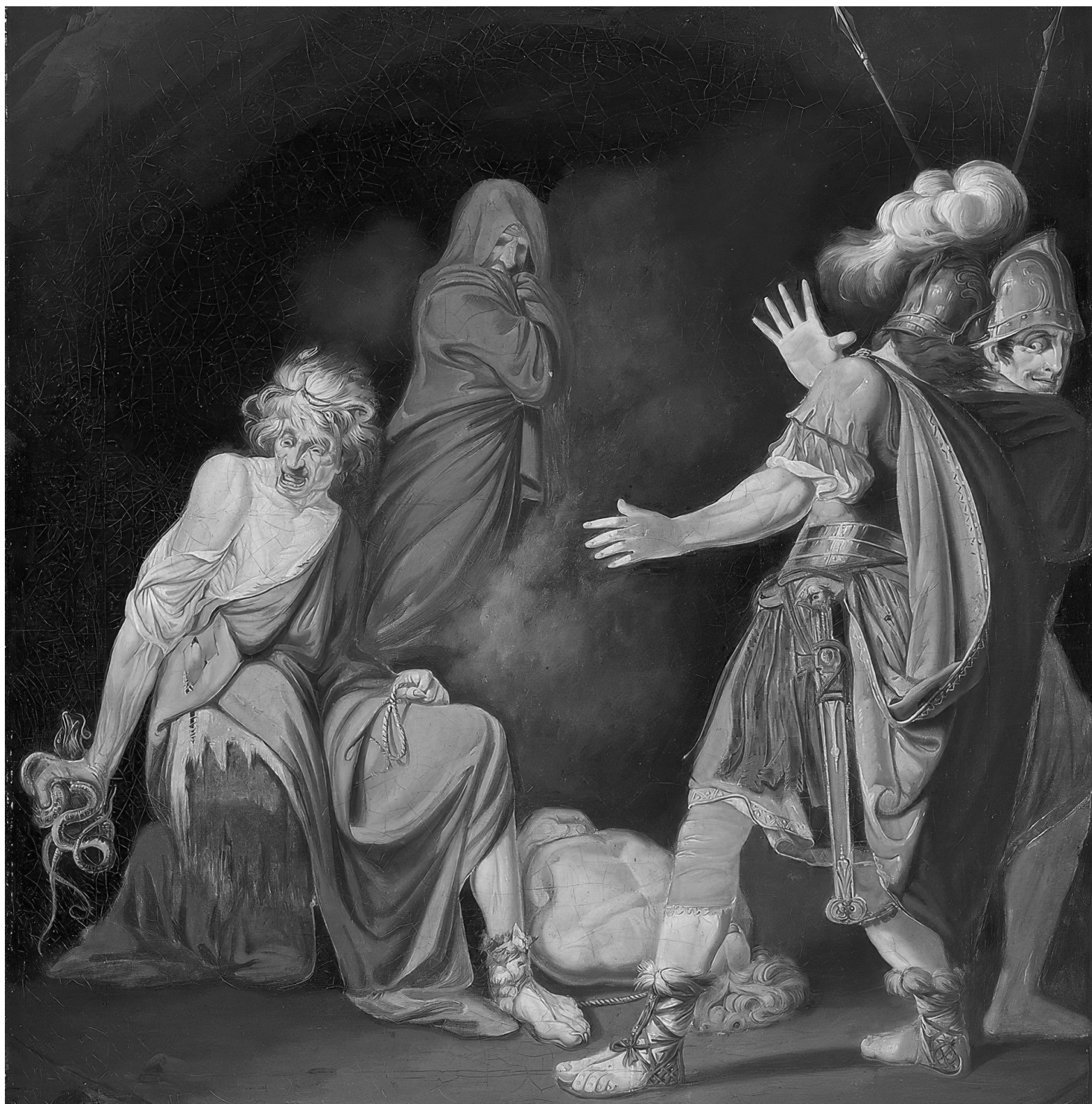
Grausig muss es sein: John Hamilton Mortimers „Sextus Pompeius befragt Erichtho vor der Schlacht von Pharsalos“, um 1771

Nun sollte man nicht meinen, dass Lucan sich angesichts des im Text greifbaren kritischen Caesarbildes zu eindeutigen Schuldzuweisungen verstiegen hätte, so leicht macht es sich der Autor nicht und empfiehlt sich auch dadurch manchem Kriegskommentator unserer Tage zur Lektüre. Die Gründe für den Krieg sind durchaus komplex, die Verantwortung ist auf viele Schultern und Umstände verteilt; die Allgegenwart des Schreckens durchwaltet nicht nur die Kampfszenen, sondern auch die zahlreichen Exkurse des Textes, seien es Landschaftsbeschreibungen, die ausführliche Wiedergabe von wegweisenden Träumen, die Aufzählung von Giftschlangenarten, die dem römischen Heer zu schaffen machten, oder die Schilderung des Ausbruchs der Pest im Lager, ein verbreitetes episches Motiv seit den Tagen der „Ilias“. Gezielt werden die Grenzen zwischen poetischer Phantasie und historischer Realität auf allen Ebenen verwischt. Auch die generische Zuordnung des Werks wurde im