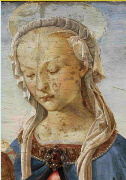
Andrea del Verrocchio, Maria mit stehendem Kind, SMB-Gemäldegalerie, Kat. 108, nach Abnahme des Firnis