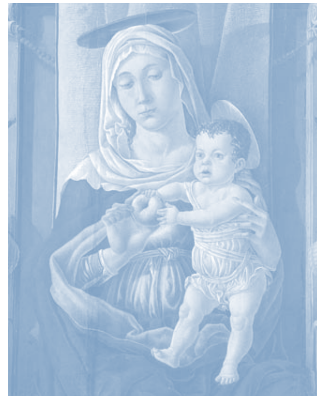
Marco Zoppo, Maria mit Kind, Detail aus einer Darstellung der Thronenden Madonna mit den Hll. Johannes d. Täufer, Franziskus, Paulus und Hieronymus, 1474, Gemäldegalerie SMB, Foto: Chr. Schmidt.

Um die bisherigen Aktivitäten auf institutioneller Ebene bündeln, intensivieren und erweitern zu können, wurde auf der Basis des Abkommens zwischen der Republik Italien und der FU Berlin vom 12.7.96 an der FU Berlin ein Italienzentrum eingerichtet.