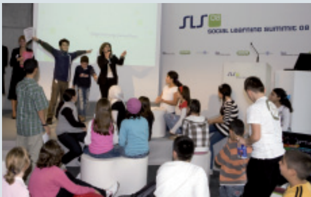
Schüler bei der Siegerehrung auf dem „Game.Floor“ des SLS o8