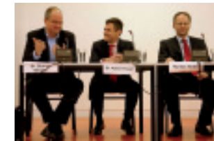
Informationstagung „Haißischbecken Berlin“ im Deutschlandradio Kultur