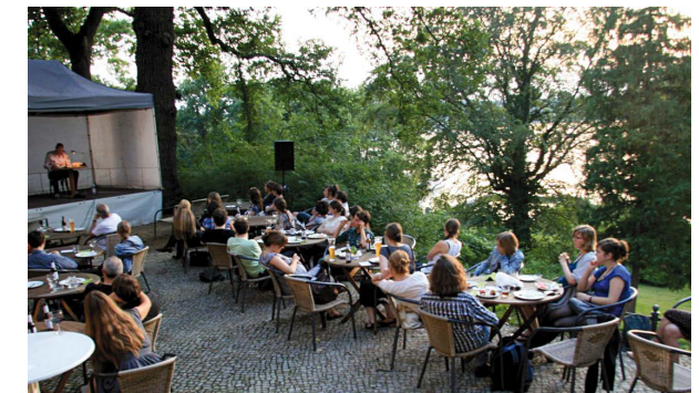
Sommerfest 2011 des Studiengangs im Literarischen Colloquium Berlin mit Lesung von Michael Lentz