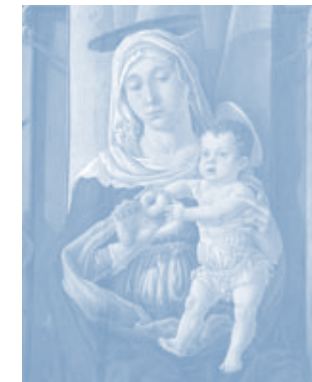
Marco Zoppo, Maria mit Kind, Detail aus einer Darstellung der Thronenden Madonna mit den Hll. Johannes d. Täufer, Franziskus, Paulus und Hieronymus, 1474, Gemäldegalerie SMB